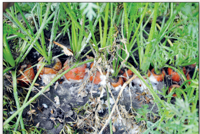
Sclerotinia in peen