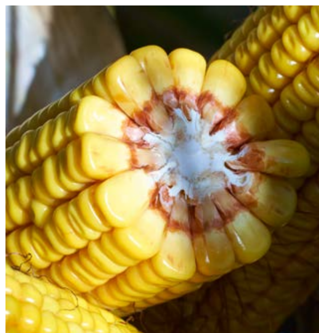
REJESTRACJA: WĘGRY 2019